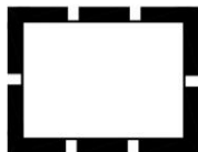
Grenze des räumlichen Geltungsbereichs des Bebauungsplans Imd 5 für SZ-Immendorf "Östlich Lähnweg" in Verbindung mit der 106. Änderung N.N. des Flächennutzungsplans